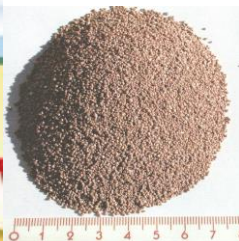
PET GRAMA UMOSTARTA SADRŽI OKO 25.000 GRANULICA