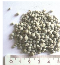
PET GRAMA OBIČNOG GNOJIVA SADRŽI OKO 200 GRANULA